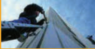
SEALING AND BONDING