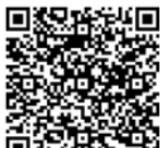
위.변조 확인용 QR 코드