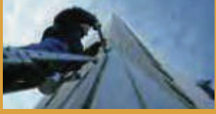
SEALING AND BONDING