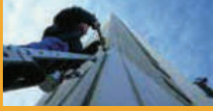
SEALING AND BONDING