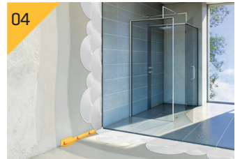
완전 양생 후 타일 접착제 최종 마감

*시공 가이드는 참고일 뿐이며, 시공 면 상태 및 환경에 따라 조절할 수 있습니다.