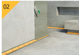
Sikalastic®-260 Stop Aqua 도막방수재 1차 도포