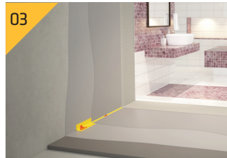
테이프 부위 2차 도포 및 완벽 밀착