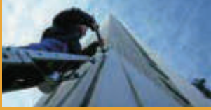
SEALING AND BONDING